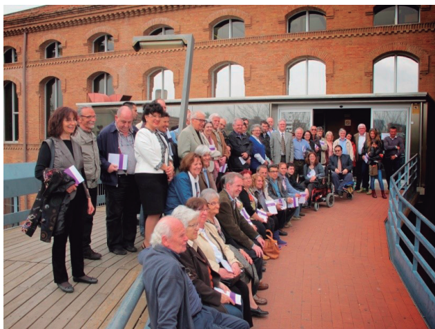
7a Trobada d'Autors i Autores de l'Hospitalet (abril 2015).

Cada dos anys fem la trobada d'autors i autores dins el programa de les Festes de Primavera de l'Hospitalet de Llobregat. El primer acte d'homenatge va ser l'abril del 2003. Des d'aleshores, cada dos anys tenim una cita obligada amb els autors i les autores de la ciutat.