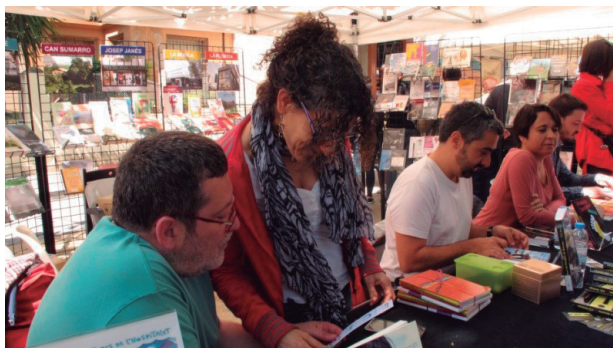
Diada de Sant Jordi (2016).

Des de la Biblioteca Central Tecla Sala preparem la festa amb antelació, perquè és una inversió de temps important. Portem a l'estand una mostra bibliogràfica considerable: tot el que han editat els nostres autors durant l'any, la qual cosa representa, com a mínim, unes cent cinquanta publicacions.